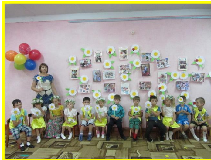
Рисунки детей «Моя семья»