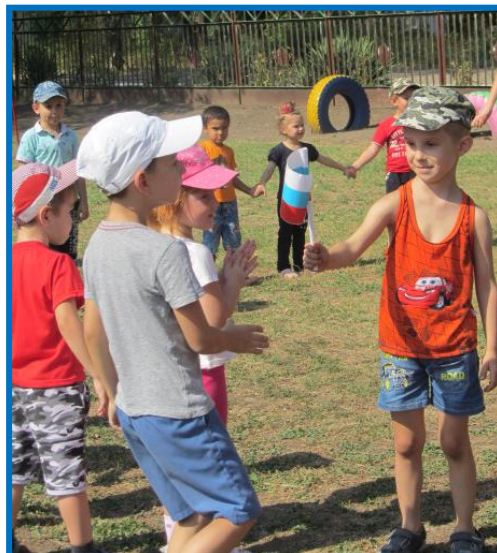
Флэшмоб (с флажками) «Мы дети твои Россия».