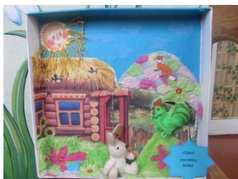
семья Носивец Вовы